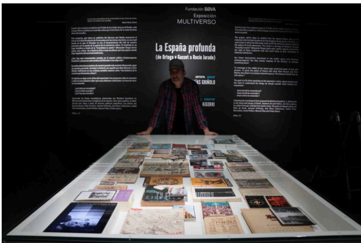
Instalación con material documental y dos cuadernos de viaje.